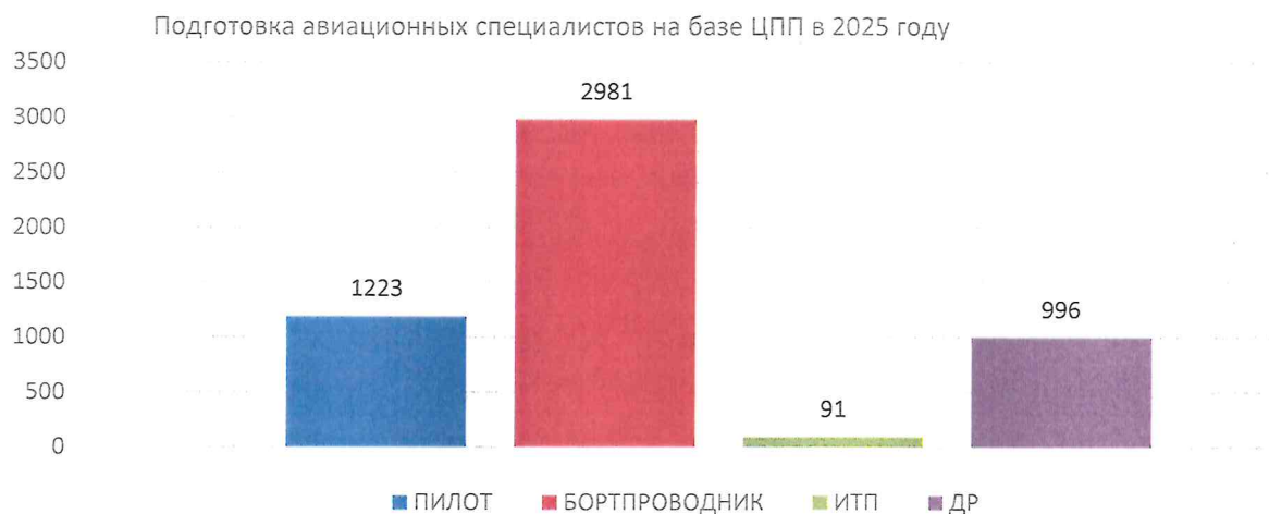
Рисунок 1 - Общее число документов, подтверждающих прохождение подготовки в ЦПП, выданных в 2025 году

2.3.1.3 Объем учебной работы имел выраженный циклический характер с максимальными значениями при подготовке к весенне-летней и осенне-зимней эксплуатации.